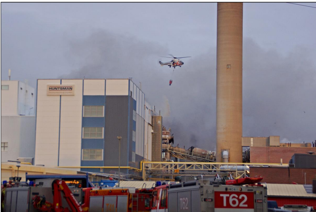
Turun VPK oli mukana Huntsman Pigmentsin titaanioksiditehtaan sammutustöissä Porissa. Sammutuksessa käytettiin apuna varvartiolentolaivueen Super Puma -helikopteria.