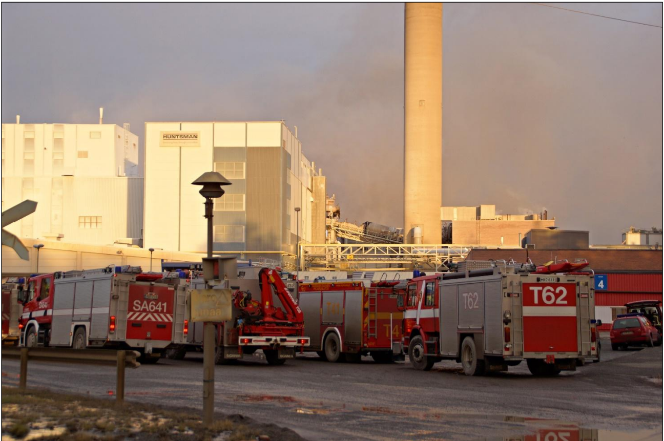
T62 Huntsman Pigmentsin tehtaan tulipalossa Porissa.

Hälytysosaston vuosikokous pidettiin 2.11.2017. Varapäälliköksi valitun erottua Turun VPK:n jäsenyydestä, pidettiin ylimääräinen kokous 7.12.2017 varapäällikön uudelleen valinnasta.