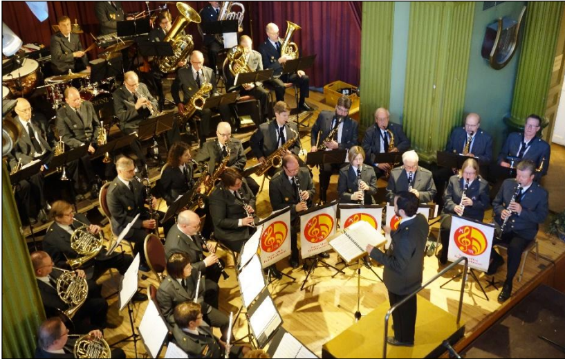
Turun VPK:n puhallinorkesterin keväinen kahvikonsertti täytti jälleen kerran VPK:n talon juhlasalin.