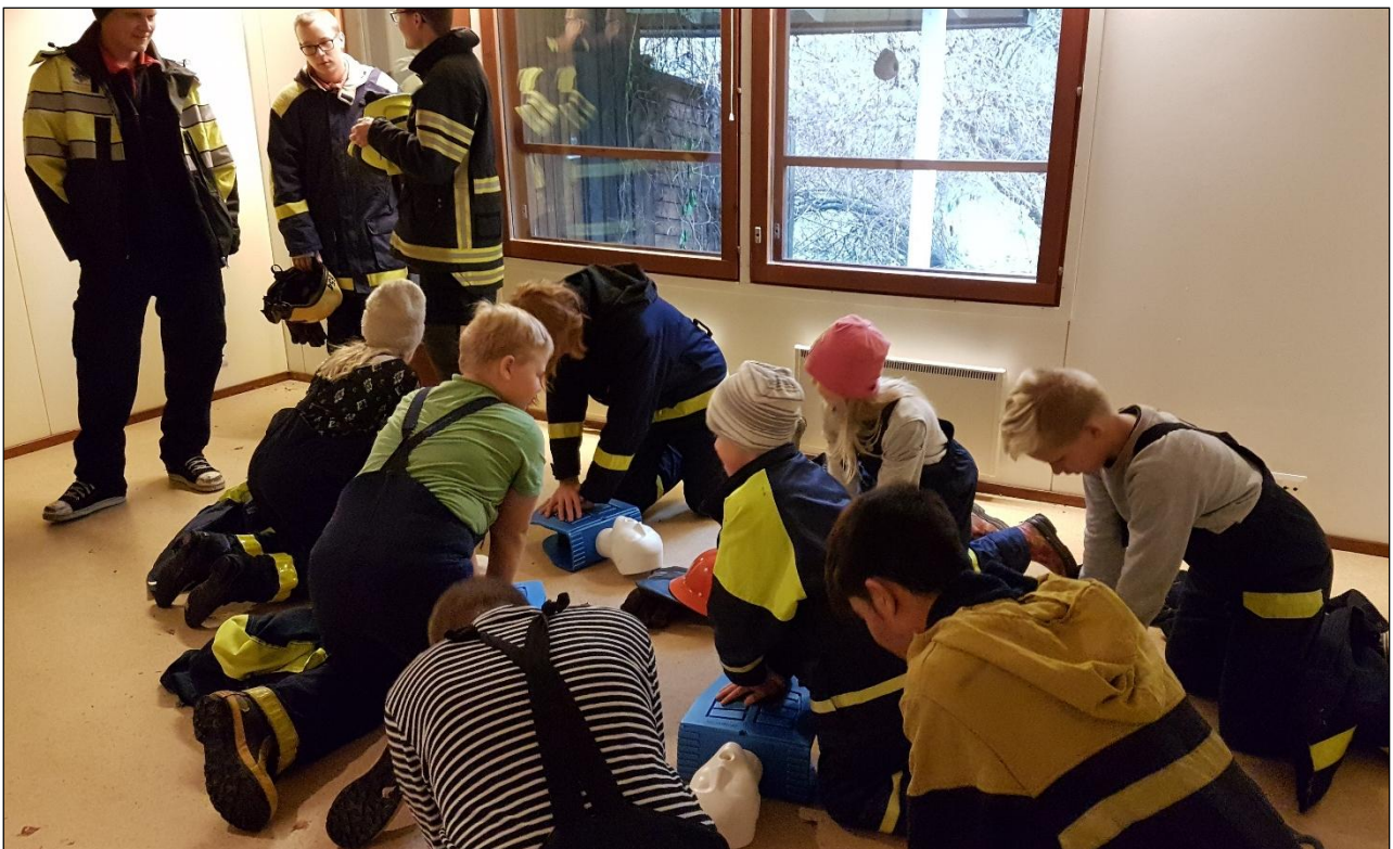
Turun VPK:n nuoriso-osasto harjoitteli potilaan kohtaamista ja painelu-puhalluselytyistä 24-tunnin päivystysharjoituksissa.

Nuoriso-osasto oli koolla erilaisten tilaisuuksien muodossa yhteensä 45 kertaa.