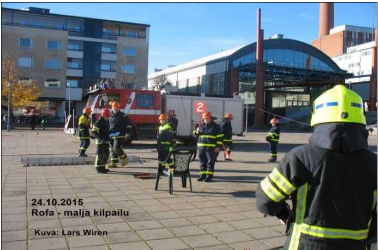
Palokuntanuoret kilpailivat Rofa-maljasta 24.10.2015 Varvin torilla.

Osasto kokoontui vuoden aikana tiistai-iltaisin viikkoharjoituksiin. Harjoitusilloissa oli mukana keskimäärin 13 osastolaista opettelemassa mm. Alkusammutusta, ensiapua ja muita palokuntalaisen perustaitoja. Tehtiin myös tutustumisia erinäisiin kohteisiin ja monenlaisen toimintaan. Harjoituksiin kuului oppituntien lisäksi erilaisia käytännön harjoituksia. Vuoden aikana siirtyi uusia nuoria mukaan myös hälytysosaston toimintaan. Yksi nuori suoritti NOK-kurssin ja yksi STK:n kouluttajista kaksi suoritti NOJ-kurssin.