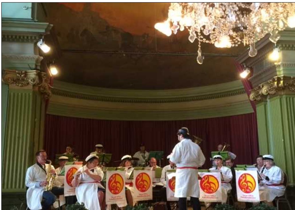
Puhallinorkesterin Vappukonsertti.

19.12. Joulukonsertti Paimion kirkossa yhteistyönä Paimion seurakunnan ja urheiluseura Paimion Hakan kanssa. Solistina toimi Tuija Saura.