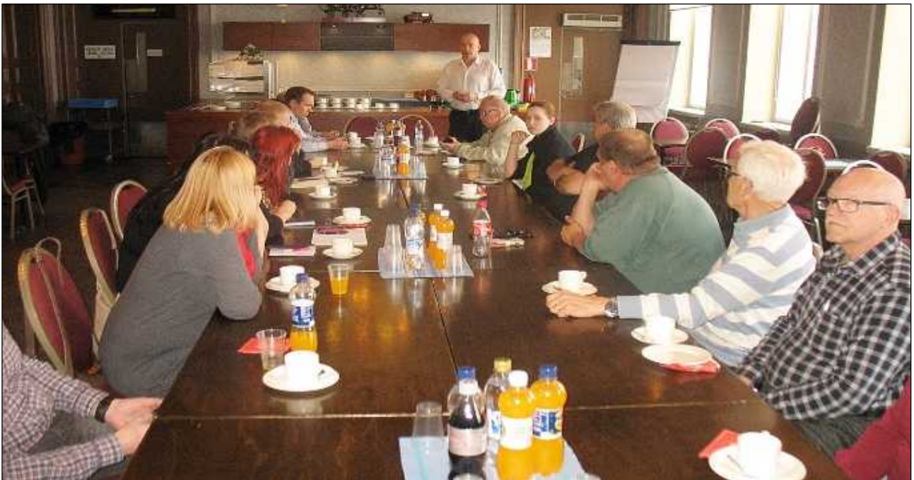
Turun VPK:n osastojen välinen yhteispalaveri 22.4.2015.

Osaston toiminta Palokunnan myyjäisten myyntipöytien järjestäminen tapahtui osaston toimesta. Samoin osasto hoiti Tapaninpäivän ja Uudenvuodenaatontanssien järjestysmiestehtävät.