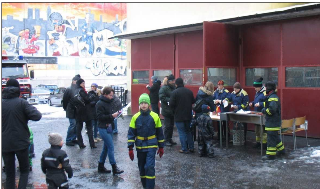
Päivä Paloasemalla tapahtuma 22.11.2015.

Osallistuttiin muiden osastojen kanssa yhdessä joulumyyjäisten järjestelyihin.